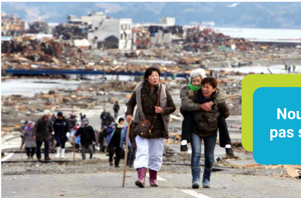
Survivors leave Tohoku a day after the March 11, 2011 earthquake and tsunami.

Nous parlons de liens sociaux, pas seulement de sacs de sable.